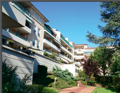
Les Cèdres d'Ombreval