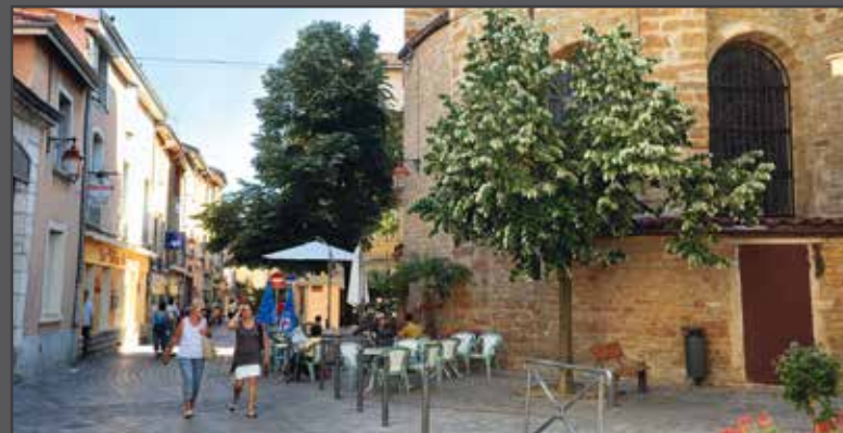
Les rues commerçantes du centre historique à 250 mètres

Après avoir déposé vos enfants à l'école et effectué quelques courses, vous vous laisserez happer par le charme des ruelles piétonnes dont l'offre commerciale est variée et de qualité.