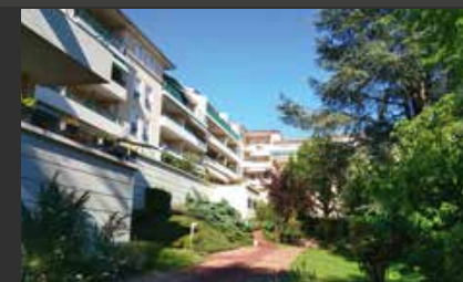
Les Cèdres d'Ombreval